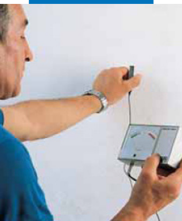
Проверка влажности гипса