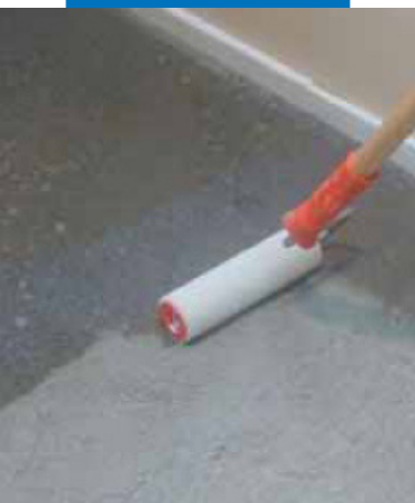
Нанесение Primer G валиком