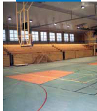
Пример использования Primer G перед укладкой ПВХ и линолеума в спортивном зале - Спортивный зал Гданск Оруна - Польша

Primer G не опасен в соответствии с нормами классификации смесей. Рекомендован к применению с обычными мерами предосторожности при работе химическими продуктами. Паспорт безопасности доступен по запросу.