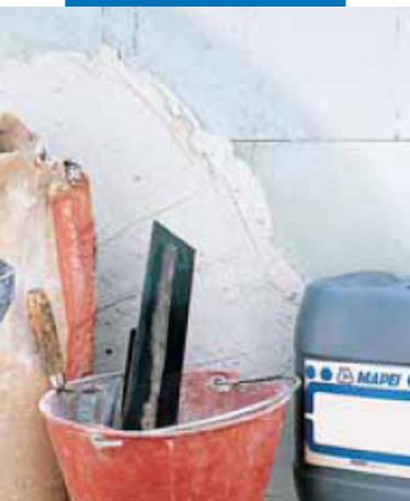
Использование в качестве грунтовки для гипсовой штукатурки